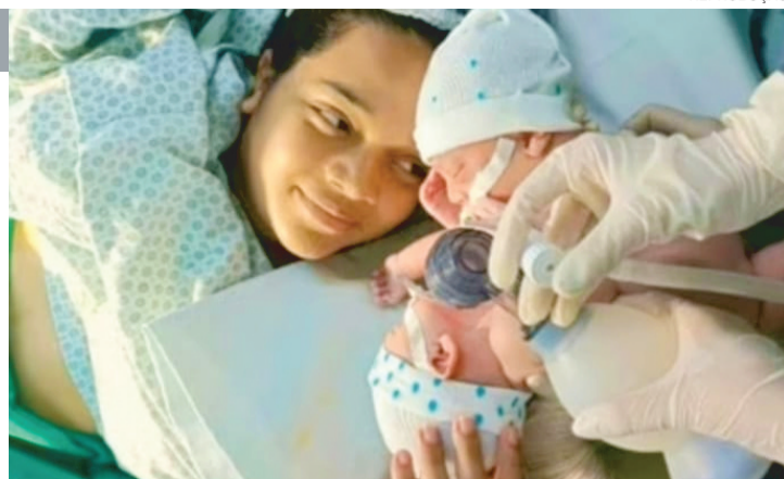
Bebês nasceram unidos pelo quadril e compartilhando órgãos vitais