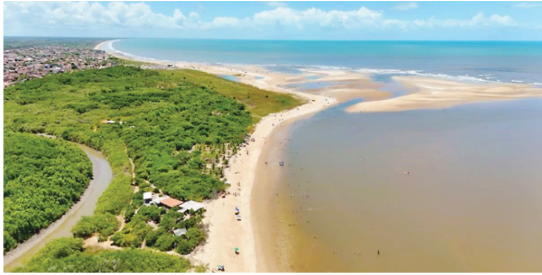
A Prefeitura de Mucuri, no sul da Bahia, anunciou oficialmente que não realizará a festa de Réveillon 2026

Desde 2021, a gestão atual já pagou R$ 178.342.325,40 em dívidas herdadas, mas ainda enfrenta um passivo